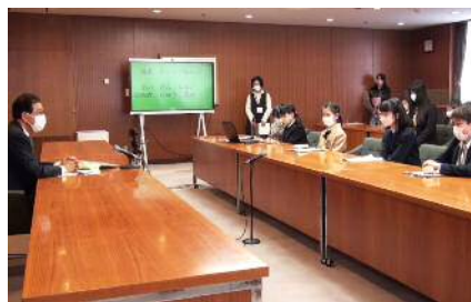
▲市長報告会の様子