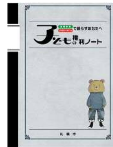
▲里親・ファミリーホーム用 (高学年版)