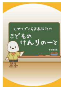
▲施設用 (幼児・低学年版)

なお、内容は措置先や子どもの年齢、理解の程度に応じたものになるよう工夫している。