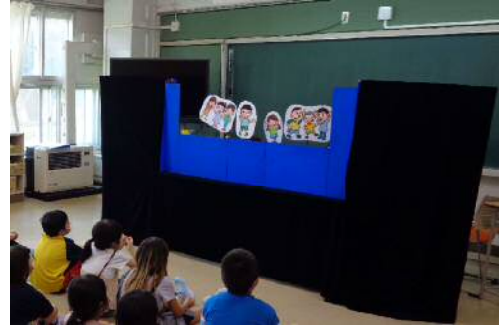
▲ペープサート人形劇の様子

また、障がいを抱えた子どもやその保護者からの相談や救済の申立てに適切に対応していくため、障がい福祉課と連携し、障がいを抱える子どもの権利を守る環境づくりの第一歩として、障がい児施設の従事職員に、子どもの権利とアシストセンターに関する見識を深めてもらうよう、令和4年度に指定障害福祉サービス事業所等に対して行った「障害者総合支援法及び児童福祉法に基づく集団指導」の項目に「子どもの権利」を追加した。