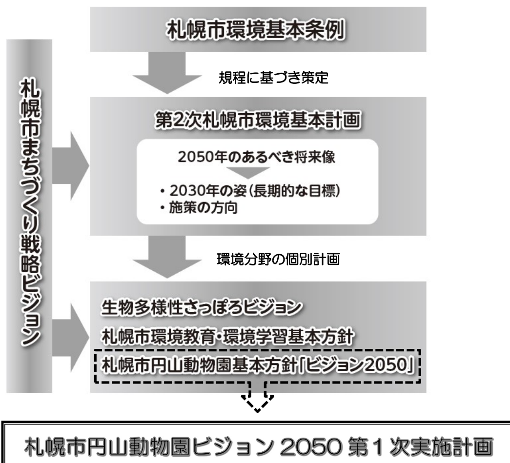
関連条例・計画等の関係

さらに、持続可能な開発目標（SDGs）については、円山動物園においても、17の目標のうち、生物多様性の損失の阻止を目指す「15 陸上資源」を筆頭に、「4 教育」「6 水・衛生」「7 エネルギー」「12 生産・消費」「13 気候変動」「14 海洋資源」に関連した取組を推進します。