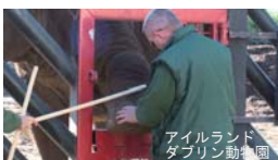
アイルランド ダブリン動物園