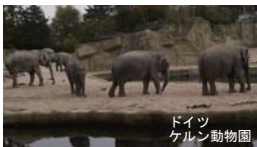
ドイツ ケルン動物園