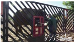
アイルランド ダブリン動物園