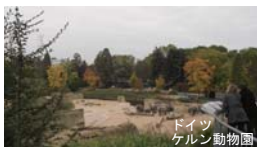
ドイツ ケルン動物園