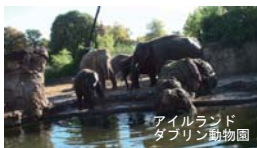
アイルランド ダブリン動物園