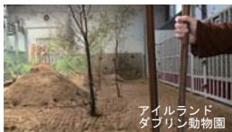
アイルランド ダブリン動物園

水遊びが大好きなゾウのために水場を設置するほか、 餌を探す様子が見られるように工夫します。