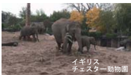
イギリス チェスター動物園