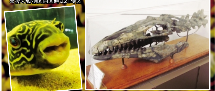
▲テトラオドン・ムブ ▲白亜紀時代を生きた生物の化石がやって来る!