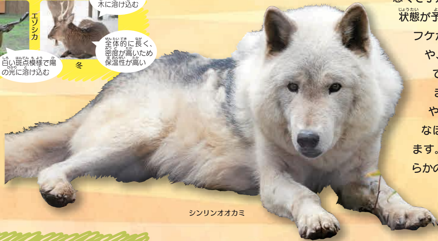
シンリンオオカミ

ほ乳類はからだ毛で覆われているという特徴があり、ほとんどのほ乳類は長くて厚い保護毛と短く柔らかい下毛が生えています。これらの毛の役割としては、主にはからだの保護や保温とされています。