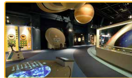
青少年科学館展示コーナーリニューアル