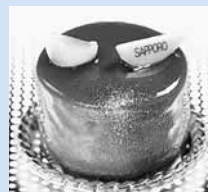
↑ さっぽろハスカップフロマージュ

「さっぽろスイーツ」を都心部から発信する、新たなカフェの設置・運営を支援。市内のさまざまな洋菓子店のケーキを楽しめます。