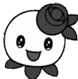
白石区マスコットキャラクター しろっぴー