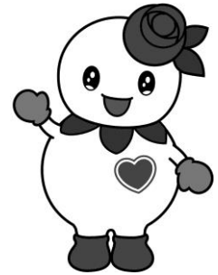
白石区マスコットキャラクター しろっぴー

★ 6月25日（木）より、新聞や雑誌などの館内閲覧、一部座席の利用を再開 の予定です。もうしばらくお待ちください。なお、 2階読書室・休憩コーナーは当面利用できません 。