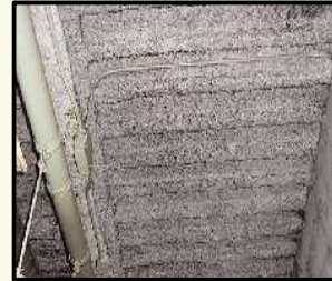
吹付けロックウール