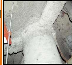
吹付けアスベスト