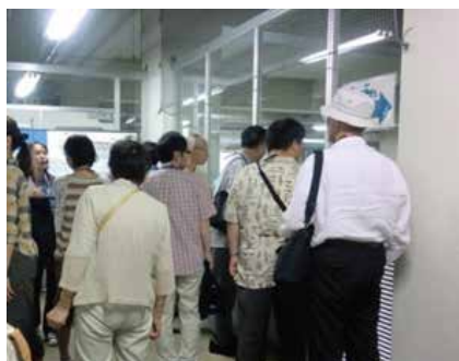
藻岩浄水場見学ツアー