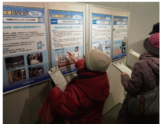
札幌水道ビジョンフェアの様子

また、平成 27(2015) 年 1 月 16 日(金)、17 日(土)に札幌駅前通地下歩行空間にて実施した「水道凍結防止キャンペーン」の会場で札幌水道ビジョン（案）を配布し、意見募集をPRしました。