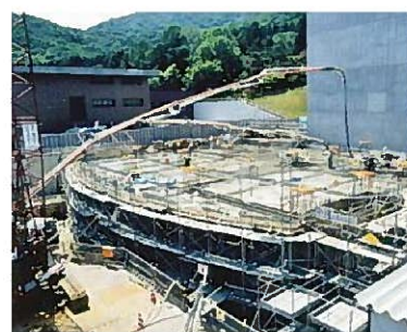
藻岩浄水場改修工事(平成9~15年)

水道創設から75年以上が経過し、札幌水道は給水人口が192万人を超え、水道普及率はほぼ100%を達成するなど、全国でも有数の水道事業に成長しており、市民生活や都市活動を支えるライフラインとして必要不可欠な存在となっています。