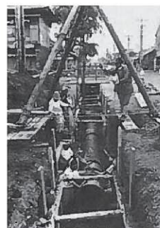
創設期の配水管工事 (主に人の手や馬の力による)

しかし、人口の増加と都市化に伴い、地下水の水質汚染が進み、公衆衛生の向上や消防水利の確保など、水道の必要性が高まったことから、昭和12年(1937年)、札幌市を一望する藻岩山のすそ野に建設した藻岩浄水場から当時の札幌市の人口の約45%にあたる9万2千人に通水したのが札幌水道の始まりです。