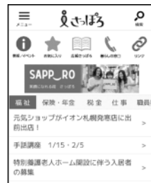
iさっぽろトップ画面

問9 あなたは、札幌市からのお知らせ情報が地上デジタルテレビの「データ放送」で配信されていることを知っていますか。あてはまるものに 1つだけ ○をつけてください。