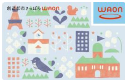
【創造都市さっぽろWAON】

これらのカードをイオングループの各店舗やWAON加盟店でご利用いただくことにより、その利用金額の一部を札幌市に寄付し、文化芸術・観光振興に役立てていただいております。