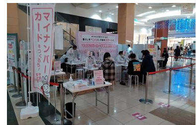
【マイナンバーカード申請の出張受付】

札幌市のマイナンバーカード取得率向上に向け、2021年よりマイナンバーカードの出張申請の受付会場の設置に協力しています。2022年度におきましてもイオンモール札幌発寒、イオンモール札幌平岡、イオンモール札幌苗穂、イオン札幌栄町店、イオン東札幌店、イオン札幌元町ショッピングセンターにて実施または実施予定です。