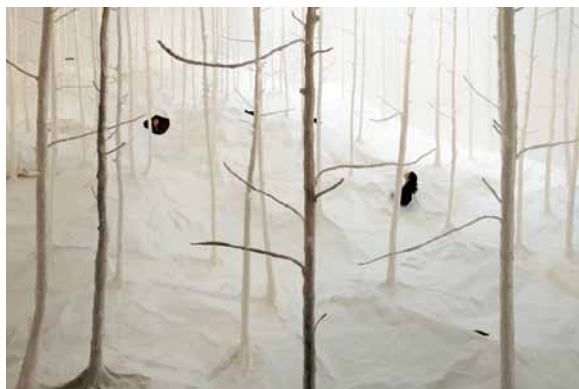
〈参考作品〉 栗林隆 「ヴァルト・アウス・ヴァルト(林による林)」2010 個人蔵

1mほどの高さ一面に張り巡らされた和紙の下をくぐり、穴 から顔を出してみよう。真っ白な紙でできたカラマツの林が 広がります。