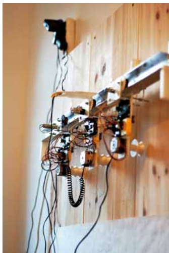
「セミセンスレス・ドローイング・モジュールズ(SDM)」プロトタイプ

チ・カ・ホ内に設置する複数のセンサーで歩行人の数を感知。その数値を基に、上からつられた十数台の振り子型ロボットが上下左右に動き、壁に色を塗り続けます。日々変化する壁面に注目しよう。