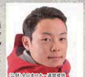
(特別)日本障害者スキー連盟提供

岩手県出身で4兄弟全員がスキージャンパー。今シーズンはワールドカップで5戦中3勝しており、年間総合優勝に向けて好発進している。