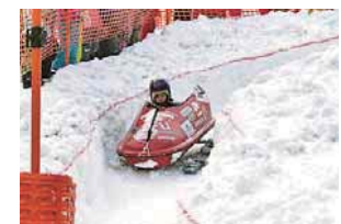
▲子ども向けのボブスレー体験は大人気

アイスホッケーやスノーボードなどを体験できるイベント。道具は全て借りられるほか、専門のインストラクターに教わることができる種目もあります。