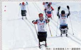
(特別)日本障害者スキー連盟提供

ワールドカップのシーズン最終戦で、年間の総合順位が決まる重要な大会。3/16(土)の競技終了後には、出場するパラアスリートと一緒にスキーやバイアスロンを体験できるイベントを開催します。