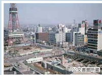
▲地下街の建設が進むテレビ塔付近

35カ国1,128人の選手らが、11日間にわたり熱い戦いを繰り広げた。大会に向けて競技施設や、地下鉄南北線が開業するなど都市基盤が一気に整っていった。こうした環境と大きな大会を成功させた実績を生かして、その後も数多くの国際大会の舞台となった。