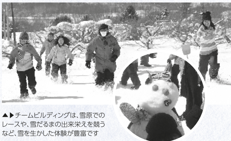
▶▶ チームビルディングは、雪原でのレースや、雪だるまの出来栄を競うなど、雪を生かした体験が豊富です

海外企業が成績優秀な社員を対象に行う「インセンティブツアー」。その日程に組み込みたくなるメニューを充実させて、団体旅行の誘致につなげています。例えば、チーム対抗で課題に取り組む「チームビルディング」を、観光名所や自然を舞台に実施。札幌ならではの体験の中で団結力を高められると、参加者に好評です。