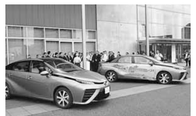
↑昨年7月に札幌で開催した「世界冬の都市市長会議」で燃料電池自動車の試乗会を実施

電気自動車などの購入費を補助するほか、燃料電池自動車に水素を供給する水素ステーションの整備に向け、新たに補助制度を創設します。