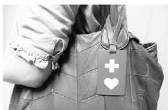
↑ストラップは鞆などに付けられます

義足や内部障がい、難病などの方が、周囲に援助や配慮が必要なことを知らせるマークを導入。マークの入ったストラップやカードを希望者に配布します。