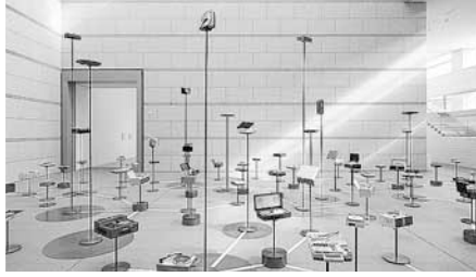
参考画像：大友 良英+青山 泰知+伊藤 隆之<(without records - mot ver. 2015)>

3年に1度開催するアートの祭典で、今回は「芸術祭ってなんだ?」をテーマに、世界で活躍するアーティストが従来の枠にとられない企画や作品を展開。アートに触れる楽しさを実感できる芸術祭を、市民の皆さんと一緒につくり上げていきます。