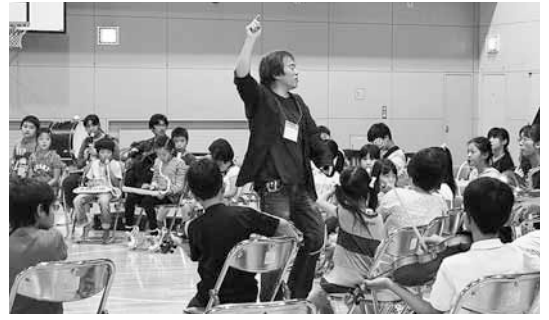
↑小学生から18歳までで結成するコレクティブ・オーケストラ。音を組み合わせて音楽を形づくり、芸術祭で発表