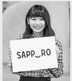
▲SAPP_RO (サッポロスマイル) は誰もが笑顔になれる街をイメージしたロゴです

講座の参加者を対象に札幌を訪れた方をあたたかく迎える笑顔の写真撮影を実施 (16時から。希望者は写真の持ち帰りが可能)。撮った写真は、今後の「おもてなし」の取り組みに活用します。