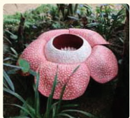
▲幻の花「ラフレシア」のレプリカはまるで本物のよう

ボルネオ島に自生している熱帯性植物を中心とした約60種類の植物を展示。今後は、昆虫や魚、爬虫類なども飼育する予定です。その他、動物や植物のレプリカなどにもぜひ注目してみてください。