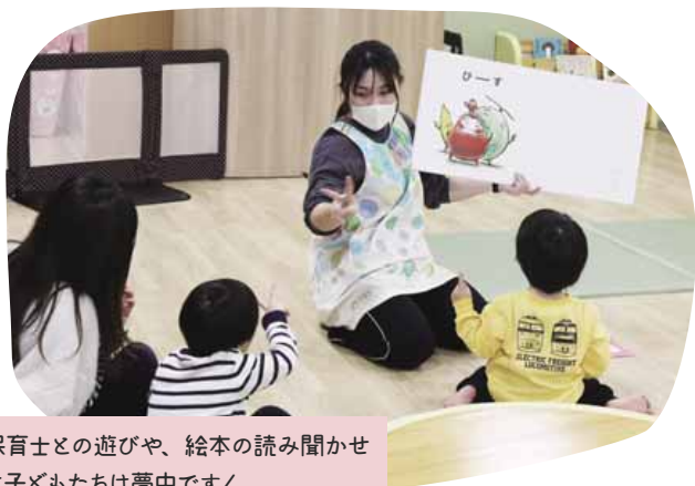
保育士との遊びや、絵本の読み聞かせに子どもたちは夢中です！

昨年市外から転入してきた際にチラシを見て興味を持ちました。子どもが広いところで伸び伸びと遊ぶことができ、子ども同士・親同士で交流できるところが魅力です。保育士さんがいるので安心できますし、アットホームな雰囲気も気に入っています。