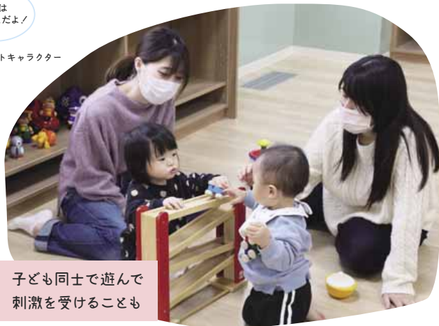
子ども同士で遊んで刺激を受けることも

親子が自由に遊ぶことができる子育てサロンです。0歳から就学前のお子さんと保護者が利用することができます。保育士が常駐しており、子育ての情報提供や相談も受け付けている他、身体測定や絵本の貸し出しも行っていきます。初めての利用は子どもも大人も緊張すると思いますが、職員が案内しますので安心してお越しください。