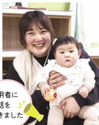
利用者に お話を 聞きました

昨年市外から転入してきた際にチラシを見て興味を持ちました。子どもが広いところで伸び伸びと遊ぶことができ、子ども同士・親同士で交流できるところが魅力です。保育士さんがいるので安心できますし、アットホームな雰囲気も気に入っています。