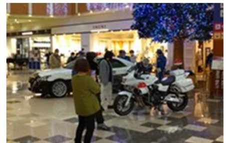
【イオンモール札幌発寒の展開】

札幌市内での人身交通事故発生件数は前年を上回り、交通事故による死傷者数も増加傾向にある中、冬の交通安全運動期間に合わせ、交通安全に関する気運を醸成し、交通事故の抑止を図るべく、札幌市、札幌市交通安全運動推進委員会、北海道警察本部交通機動隊、札幌方面西警察署とイオン北海道が交通安全啓発イベントを協働で開催しました。