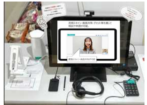
【店舗設置のイメージ】