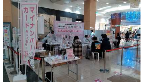
【マイナンバーカード申請の出張受付】

札幌市のマイナンバーカード取得率向上に向け、2021年よりマイナンバーカードの出張申請の受付会場の設置に協力しています。2022年度におきましてもイオンモール札幌発寒、イオンモール札幌平岡、イオンモール札幌苗穂、イオン札幌栄町店、イオン東札幌店、イオン札幌元町ショッピングセンターにて実施しております。開始以来10月末までのご利用者は累計34,640名となりました。