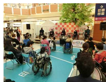
【イオンモール札幌発寒】

「イオン de パラスポ」は、ご来店される多くのお客さまに、パラスポーツの体験や交流イベントを通し、多様な方々が相互に支え合う心のバリアフリーへの理解を深めていただくことを目的に2019年から全国のイオンで開催しております。北海道では、札幌市や一財札幌市スポーツ協会に共催いただき、5月29日(日)イオンモール札幌発寒にて初めて開催しました。イベントでは、シットスキーやボッチャの体験会のほか、トークショーや、みんなで応援！パラスポーツの魅力発信展などを実施しました。