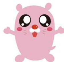
さぽーとほつと基金公式キャラクター キャッピー

スタートアップ助成事業は、活動歴が1年未満で構成員が5人以上の団体が対象です。5万円もしくは助成対象事業費のいずれか低い額を助成します。