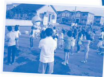
●ラジオ体操 夏休みは毎日ラジオ体操を実施。特別ゲストの東区マスコットキャラクター「タッピー」と一緒に。

「子ども」が多く暮らす地域であることから、イベント隊(3名)を中心として、子ども・子育てに関わる取組に力を入れています。自慢はハロウィン+クリスマスの「ハロウスマス」。年々参加者が増え、約150人が参加します。