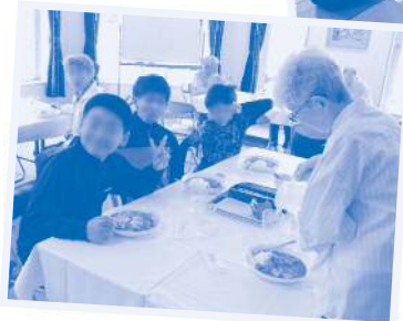
●ゆるヨガ 老若男女、世代を超えてゆる〜くヨガを楽しんでいます。