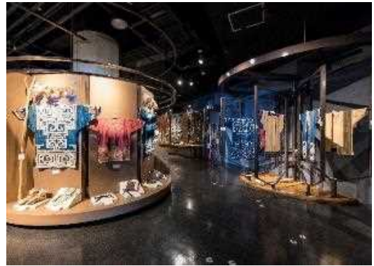
アイヌ文化交流センター展示室

また、外国人観光客に向けての情報発信のため、展示物の多言語化にも取り組んでいます。