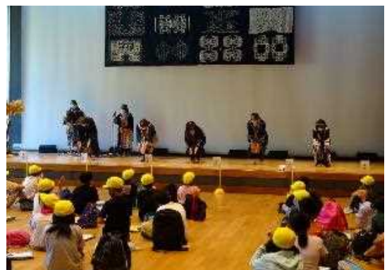
体験プログラムでの舞踊披露