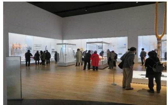
ウポポイ見学の様子

アイヌ文化の理解促進に向けた観光プロモーションの一環として、民族共生象徴空間「ウポポイ」やアイヌ文化交流センターを周遊ルートとしたバスツアーを実施しています。