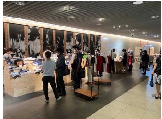
販売会開催の様子

また、アイヌ工芸品等の販売機会の確保に向け、札幌駅前通地下歩行空間やサッポロファクトリー等で、年数回販売会を開催しています。