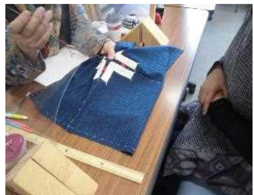
アイヌ文様刺しゅう作品制作の様子