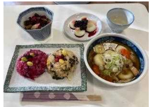
体験会で調理したアイヌ料理