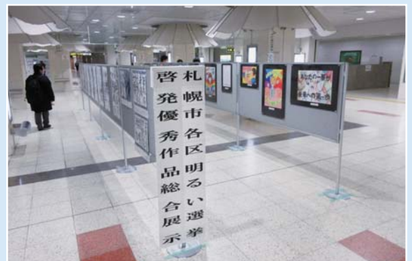
令和4年度の作品展の様子

令和5年度は、令和6年3月19日(火)から25日(月)までさっぽろ地下街オーロラタウン・オーロラスクエアで、開催しますので、ぜひご覧ください。