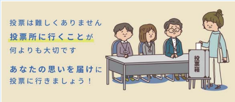
投票の手順を説明した動画

また、4月3日は、さっぽろ地下街で街頭啓発を実施し、多くの方に投票参加を呼びかけました。今後も投票率向上に向けた取組を続けていきます。