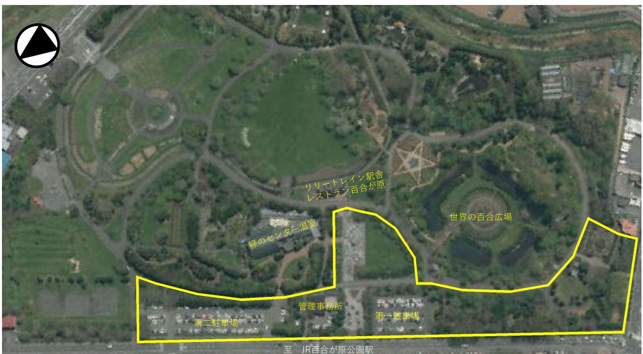
図15 公募区域詳細図(黄枠内)