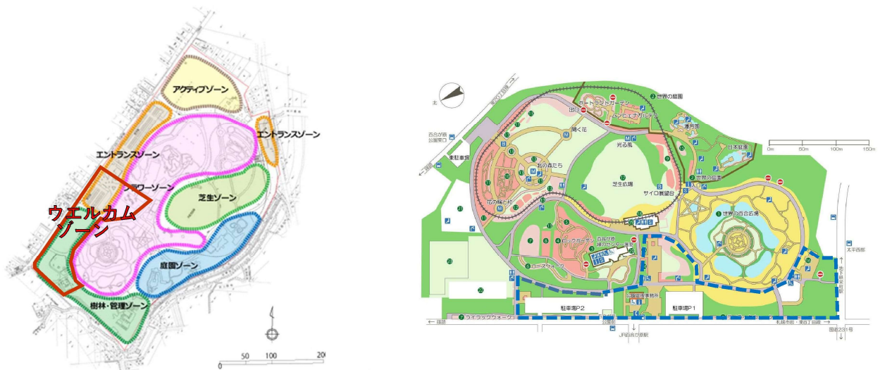
図14 公園ゾーニング図(左図)と公募区域位置図(右図青枠内)