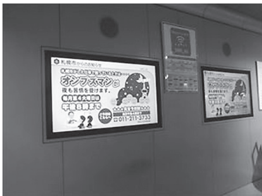
地下歩行空間の大型ビジョン(R2.9)