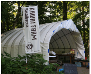
かわいふあ〜む yasaibacca 営業日：夏は基本毎日(雨天はお休み) 時間：10:00頃(お野菜が並んでから)~17:00頃 詳細はFacebookページをご確認ください

7、8年前よりも新しい人が入ってきて、変わってきている雰囲気があります。一方で、高齢化により長い間、協力し合ってきた地域関係がうまく回らなくなるのでは、と心配しています。例えば、ゴミ拾いや会館のトイレ掃除を日々してくださっている方がいますが、いつまで続けてもらえるか…。これからの小別沢の地区運営を検討し取り組んでいける、同じ方向や目的を持った人が増えていったらいいなと思います。