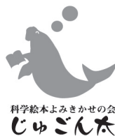
科学絵本よみきかせの会 じゅごん太