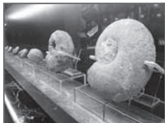
日本生命札幌ビルNOASIS3.4 1階 (協力: 日本生命札幌ビル)