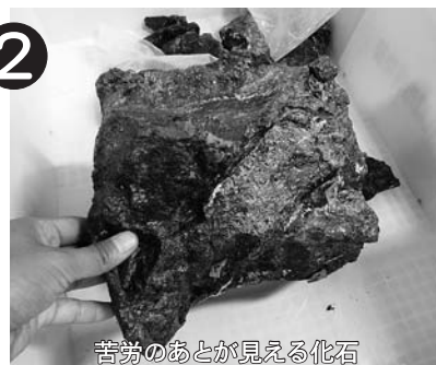
苦勞のあとが見える化石

クジラ化石は11月からの企画展で全てお見せします。展示のお知らせは次のページをご覧ください。