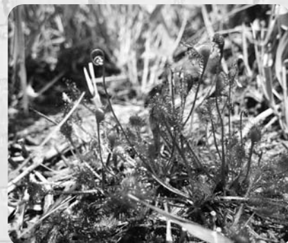
モウセンゴケ (つぼみが見えます。コケ植物ではありません。)