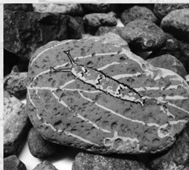
川原の石が…葉や幼虫、動物へとカラフルに変身!