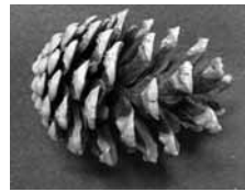
写真1 【まつぼっくり】 タネを飛ばした後の「ぬけがら」。タネの“入れ物”。

この夏、札幌市博物館活動センターでは、札幌市内のセミのぬけがら調査をします。札幌にどんなセミがいるのか、ぬけがらの情報をもとに、札幌のセミの生息地を明らかにします。みなさんに