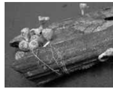
写真2 【キノコが生えた枯れ木】 枯れた木はキノコという別の命の栄養となり、「ぬけがら」となっていく。