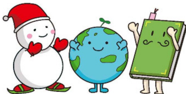
ゆっぽろ ちっきゅん おっほん