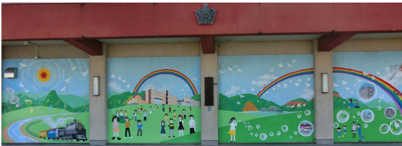
石山中学校美術部による絵が完成