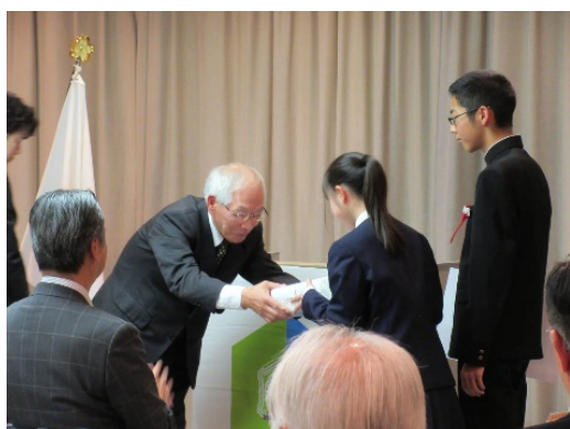
札幌市民憲章表彰式の様子