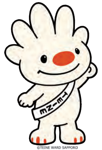
手稲区マスコットキャラクター：ていぬ