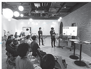
【大学等による講演】