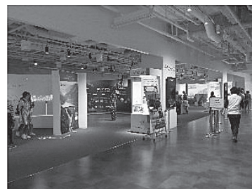
【企業展示設置ブース】