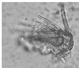
動物プランクトンの一部