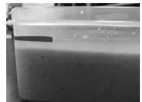
図3 振動させた後の砂のかさ