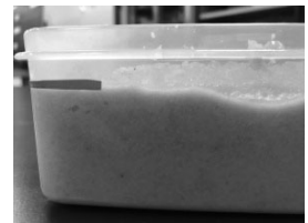
図2 振動する前の砂のかさ