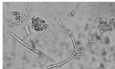
植物プランクトン