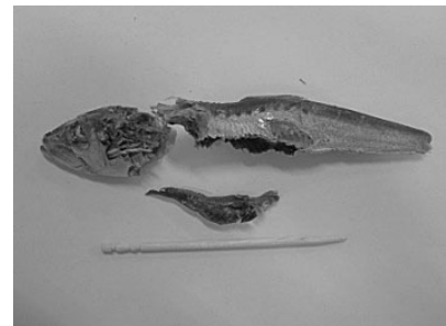
使用した煮干し (胃の部分を取り出したもの)