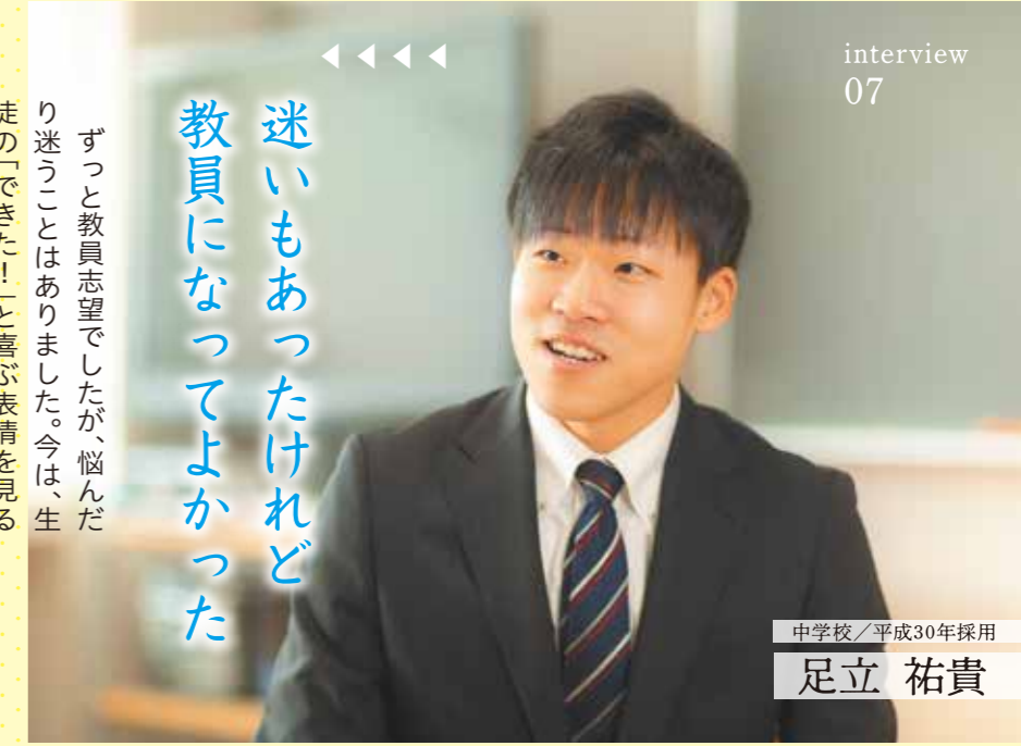
中学校/平成30年採用

ずっと教員志望でしたが、悩んだり迷うことはありました。今は、生徒の「できた！」と喜ぶ表情を見るたび、先生になってよかったと感じています。現在は、一年生のときから関わっている三年生のクラスを受け持っていますが、生徒の大きく成長する姿を間近で見られるのもうれしいです。この仕事にゴールはなく、学校では常に新しいことが起きます。自分も成長しようという気持ちを持ち続け、多感な中学生のそれぞれの想いや考えをきちんと感じ取って、良いところを伸ばしてあげたいです。