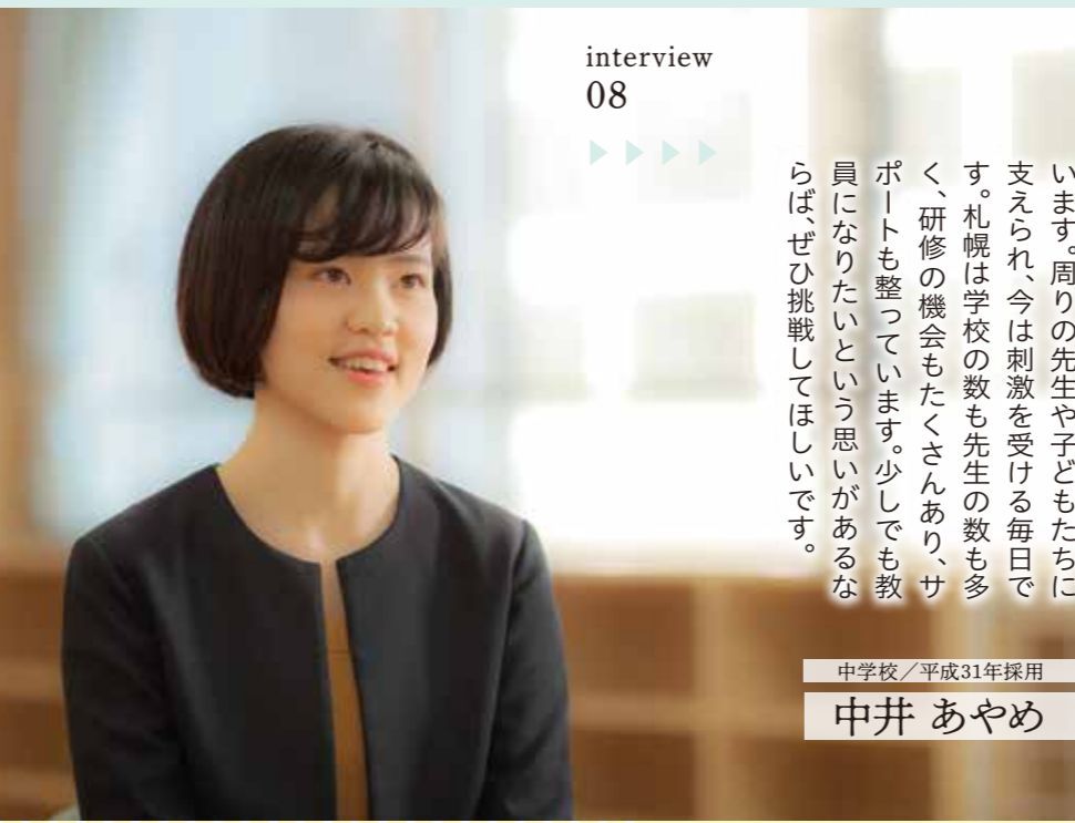
中学校/平成31年採用

一年目でまだまだですが、子どもたちが何でも話しやすい教員を目指しています。大変そうなのになぜ教員を志望したの？と聞かれることもありましたし、好きな英語を話させるグラウンドスタッフになるか迷ったときもありました。でも、今は教員になってよかったと思っています。周りの先生や子どもたちにも支えられ、今は刺激を受ける毎日です。札幌は学校の数も先生の数も多く、研修の機会もたくさんあり、サポートも整っています。少しでも教員になりたいという思いがあるならば、ぜひ挑戦してほしいです。