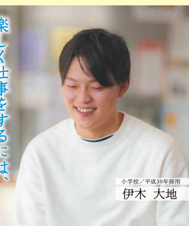
小学校/平成30年採用

学校という場所が好きで、小学校の時の先生がいつも笑顔で楽しかったこともあり、子どもの頃から教員志望でした。その一方で、正直残業が多い、準備が大変というイメージもどこかにありました。教員になって分かったのは、見通しをもって取り組み、周りにも協力してもらえば、あとは自分次第だということ。子どもたちと過ごす学校での時間を楽しみ、笑顔でいるためには、自分に余裕がなければならぬと感じています。これからたくさんの知識を身に付け、しっかり準備していきたいと思っています。