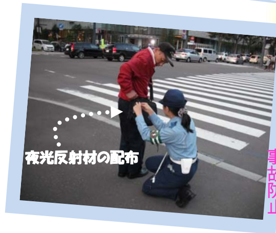
夜光反射材の配布