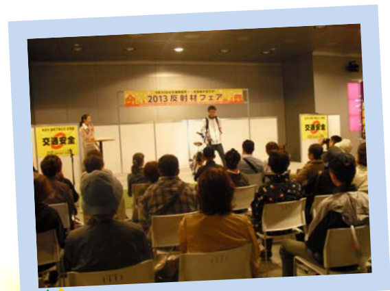
夕暮れ時と夜間の歩行中・自転車乗用中の交通事故防止