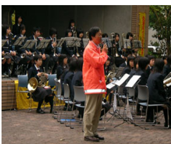
10月6日「札幌電設業協会」