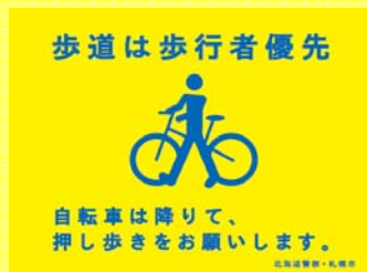
(写真)昨年度の同実験の様子