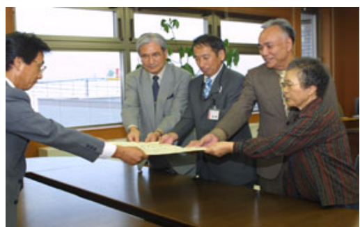
手稲区での表彰の様子です。

札幌市では、平成5年と平成13年の厚別区、本年4月の清田区に続く交通事故死ゼロ300日達成となりました。