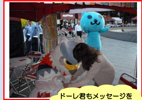
ドーレ君もメッセージを 書いてくれました