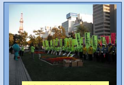
札幌電設業協会街頭啓発