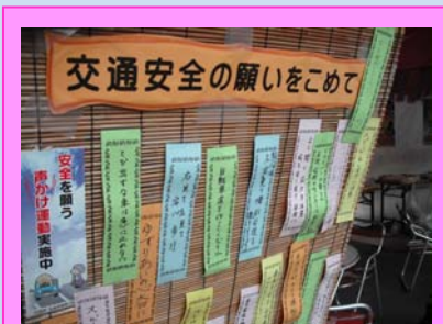
みなさんの願いが込められた短冊

「オータムフェスト」大通公園4丁目会場内において、9月30日に交通安全を呼びかける「交通安全茶屋」を設置し、関係機関と協力し、街頭啓発を実施しました。来場いただいた方には短冊に「交通安全の願い事」などを書いていただきました。また、反射材付エコバックなどを配布し、交通安全意識の高揚を図りました。