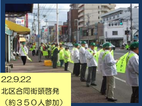
22.9.22 北区合同街頭啓発 (約350人参加)

9月21日(火)～30日(木)の日程で秋の交通安全市民総ぐるみ運動が実施され、各区で様々な交通安全の取り組みが行われました。地域のみなさんや多くの関係機関・団体等の交通安全活動もあり、期間中の市内の交通死亡事故の発生はありませんでした。運動期間後も変わらず交通事故の防止に努めていただきますよう、よろしくお願いいたします。