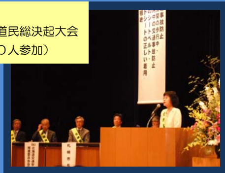
22.9.16 交通安全道民総決起大会 (約500人参加)