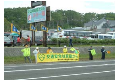
☆南区・喜茂別町合同特別街頭啓発の様子です。