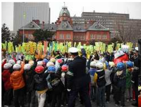
参加者全員で交通安全宣言

集い後は、道庁外周において街頭啓発を実施し、歩行者やドライバーへ交通安全を呼びかけました。