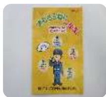
【小冊子「まもろうね!!一年生」】