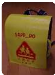
【ランドセルカバー】