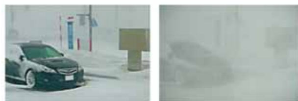
暴風雪で一瞬にして数メートル先が見えなくなる(右) 稚内市内(平成24年4月4日)