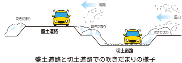
盛土道路と切土道路での吹きだまりの様子

● 道路の形状と吹きだまりの関係 道路には、まわりの土地よりも高い「盛土道路」と、低い「切土道路」があります。一般に、「盛土道路」に比べて「切土道路」では、吹きだまりが発生しやすい傾向にあります。