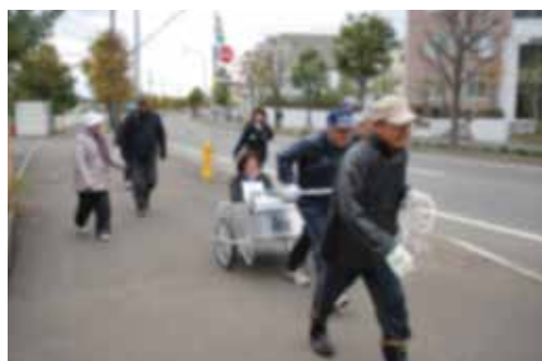
夢トピア星置町内会連合会の津波避難訓練

2011年3月の東日本大震災を教訓にして、札幌市内の海岸に近い地域では、小学校などと町内会が連携して、津波を想定した避難訓練が行われるようになりました。