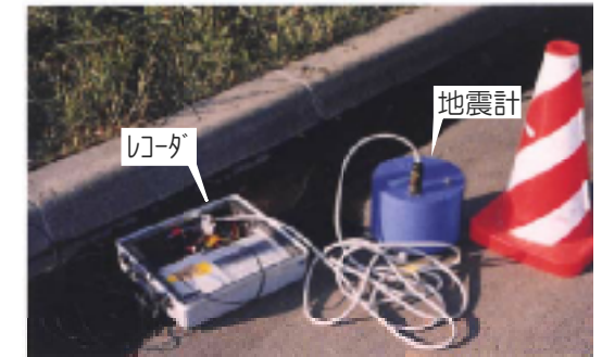
微動アレー探査の測定機器

地面はたえずわずかに揺れています。このゆれは車や工場などの人工的なものや風・波浪などの自然によるものがあります。これらのゆれを地震計で測定・分析することによって、地下のS波(よこ波)速度の分布状況を推定することができます。